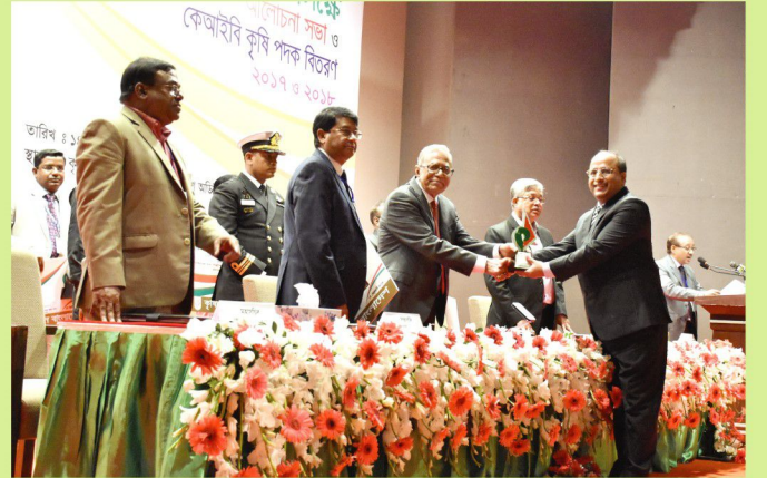
গণপ্রজাতন্ত্রী বাংলাদেশের মহামান্য রাষ্ট্রপতি নিকট থেকে “বর্ষসেরা কৃষিবিদ-২০১৮” পদক গ্রহণ করছেন।